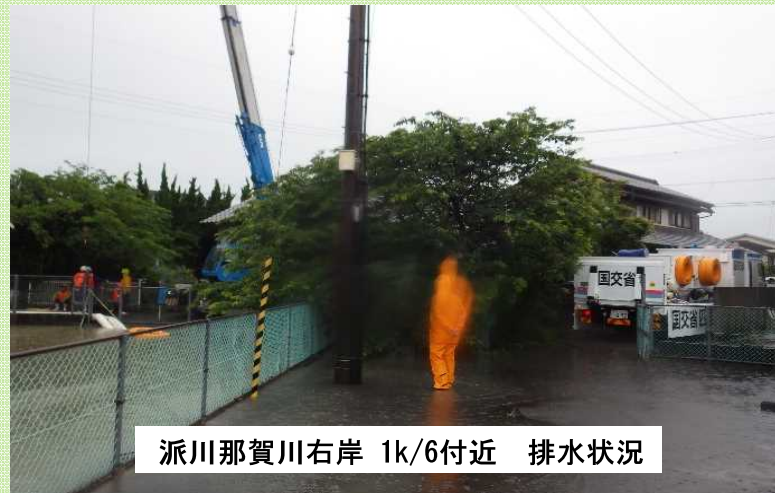
令和5年9月11日低気圧 活動状況