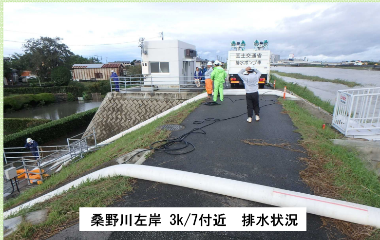
平成28年9月20日台風16号 活動状況