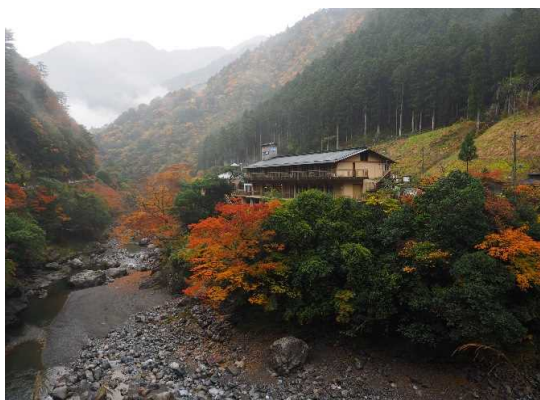
那賀川流域の紅葉