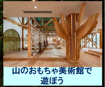
山のおもちゃ美術館で遊ぼう