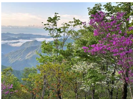
高城山の新緑 (赤:ミツバツツジ、白:ゴヨウウツツジ)