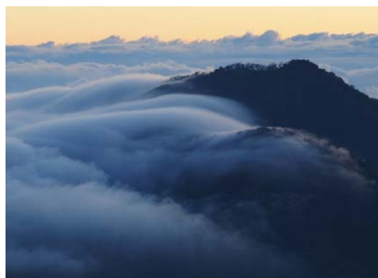
剣山スーパー林道 からの雲海