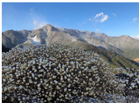
沢谷の雪とミツマタ