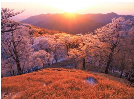
高城山の 朝陽とブナと樹氷