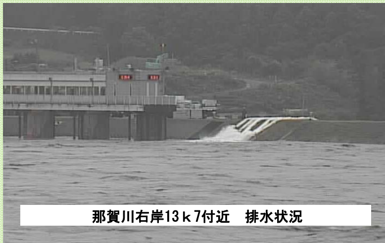
那賀川右岸13k7付近 排水状況