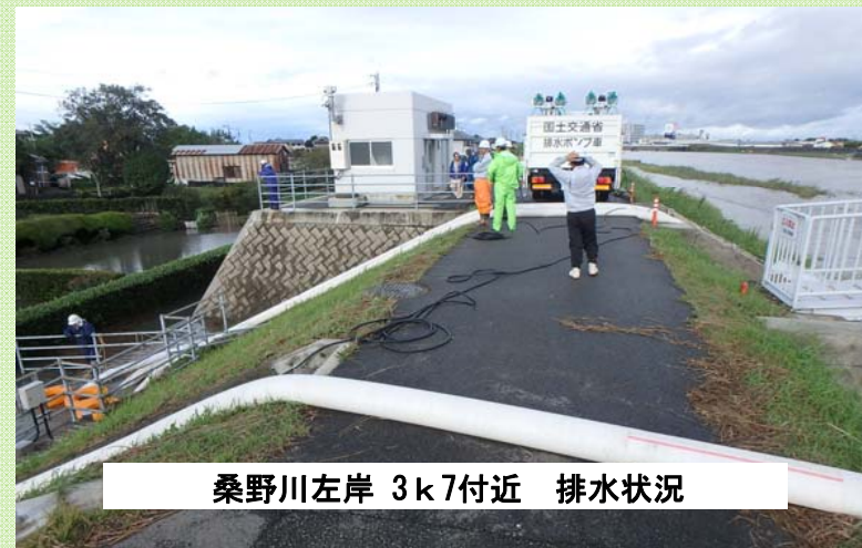
桑野川左岸 3k7付近 排水状況