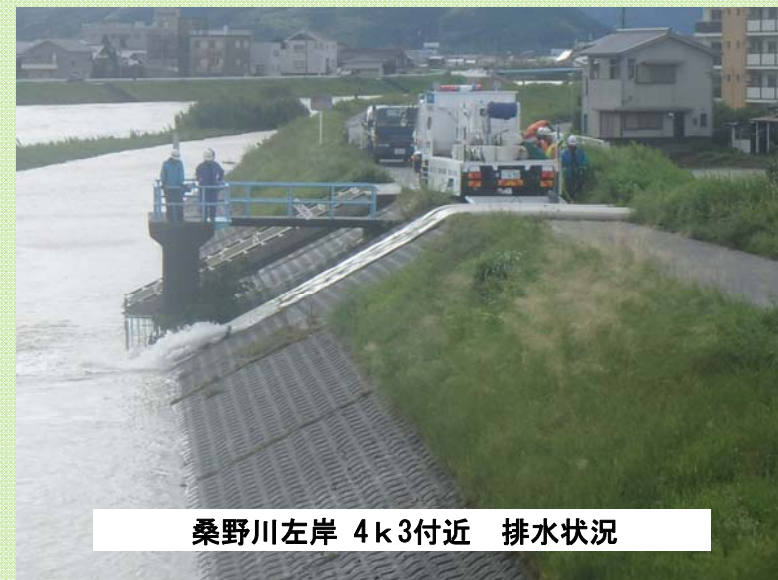
桑野川左岸 4k3付近 排水状況