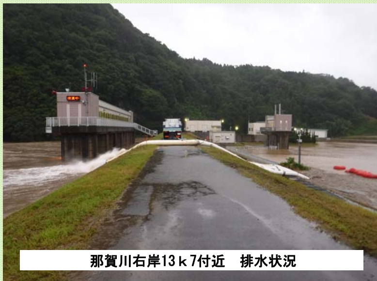
那賀川右岸13k7付近 排水状況