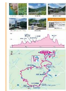
(参考) 自転車王国とくしま 掲載資料