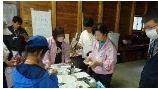
【葉の裏側に墨汁をつけて紙に転写する参加者】 【木の紙を使った折紙をする参加者】