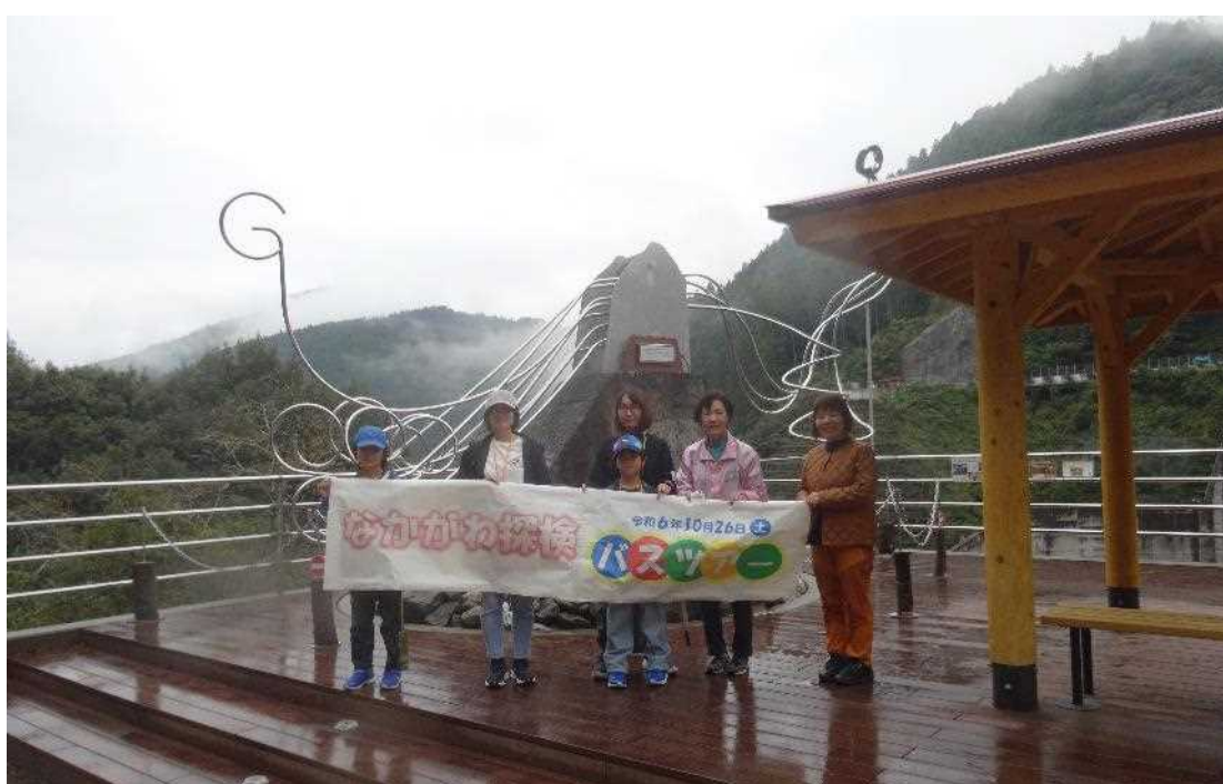
【長安ロダム左岸展望台のモニュメントを背景に記念撮影】

参加者は木の葉などを使っていろいろな楽しいことが出来ることがわかり、森への興味がわき、さらに長安ロダムの見学で、ダムへの関心を深められたようでした。