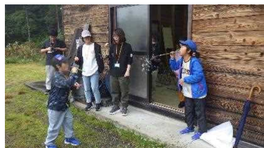
【シャボン玉を飛ばして楽しむ参加者】