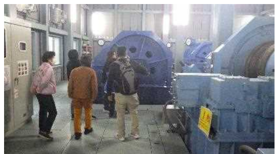
【長安ロダムの選択取水設備の模型や施設を見学する参加者】