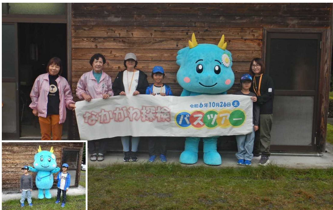
【那賀川キャラクター「りゅうな」と記念写真】

その後、長安ロダムに移動し、午後から長安ロダムの見学を行いました。最初に参加者はダム管理所内でダムの本体改造工事の動画を見ました。そして、長安ロダムにある選択取水設備の模型や施設を見学しました。