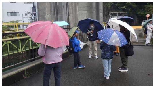
【長安ロダムクイズをしながら、ダム周辺を見学する参加者】