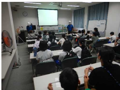
【工場の説明を受ける参加者】

その後、阿南市辰巳工業団地にある王子ネピア株式会社徳島工場を見学しました。最初に工場の紹介について動画にて説明を受けました。工場内ではトイレットペーパーやティッシュペーパーなどを生産しており、製品になるまでの工程を見て回りました。