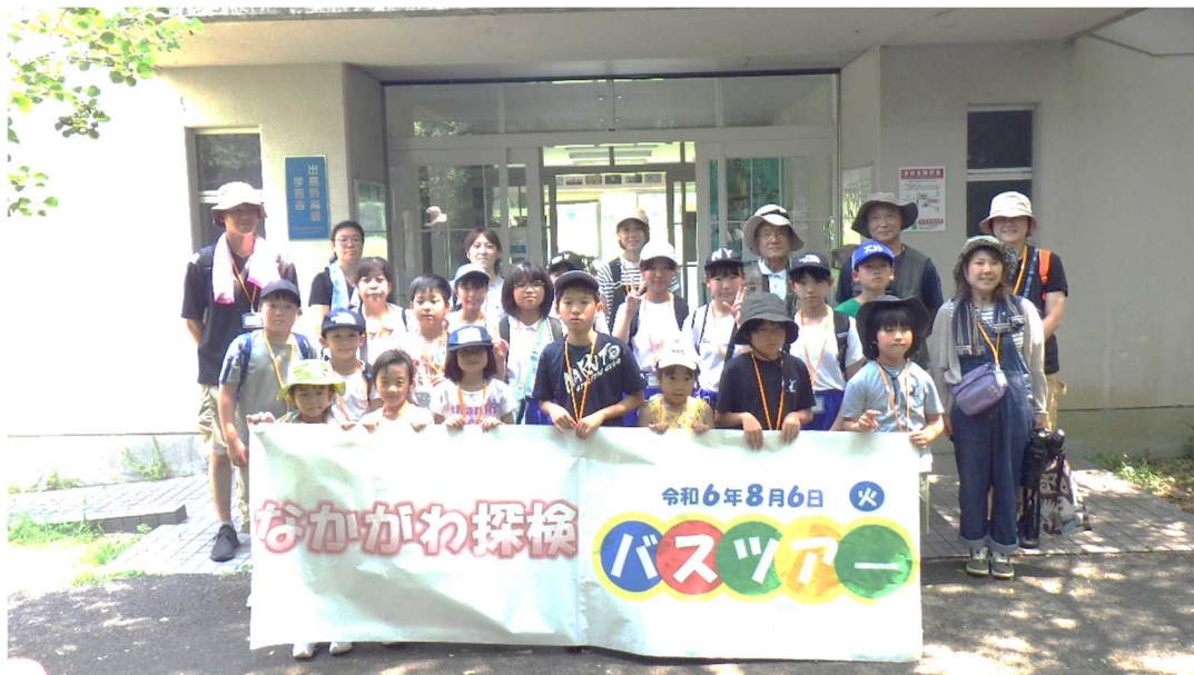
【学習舎をバックに記念写真】

その後、阿南市辰巳工業団地にある王子ネピア株式会社徳島工場を見学しました。最初に工場の紹介について動画にて説明を受けました。工場内ではトイレットペーパーやティッシュペーパーなどを生産しており、製品になるまでの工程を見て回りました。