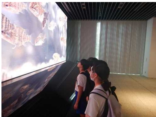
【本社内を見学する参加者】

午後からは、日垂化学工業株式会社本社を見学しました。まず、本社ショールームにおいて、自社で生産されている製品等について説明を受けました。また、本社内にある「ホテルの宿」といういろいろな魚が飼育されている場所を見学し、いろいろな魚をみる事が出来ました。