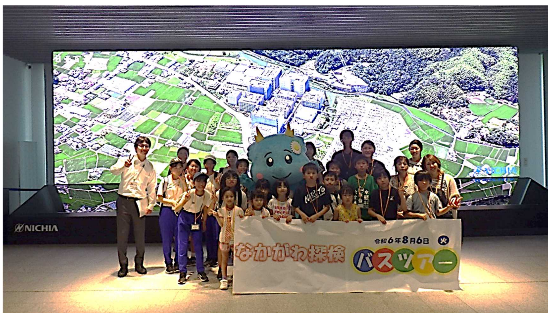
【大型ディスプレイをバックに記念写真】

ゆきかう那賀川推進会議事務局では、今後も「那賀川の日（8月6日）」に開催するバスツアーをはじめとするいろいろな取組により、那賀川流域の上下流交流を深めていき、那賀川への関心を高めてもらうようにしていきたいと思ひます。