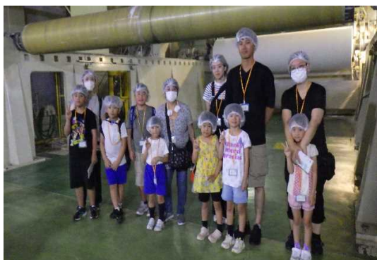
【工場内を見学する参加者】