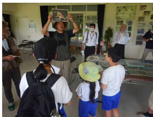
【野鳥の会の説明を熱心に聞く参加者】