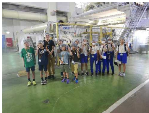
【工場内を見学する参加者】