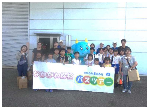
【王子製紙ネピア工場前で記念写真】