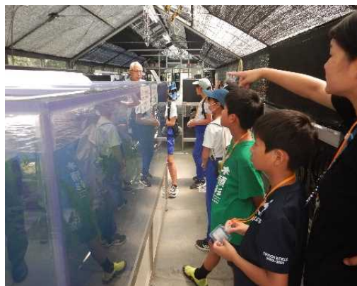
【魚の飼育場所を見学する参加者】