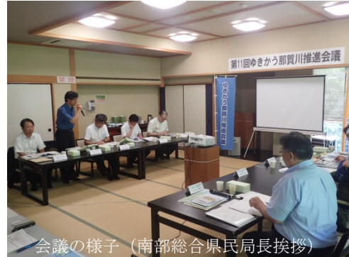
会議の様子（南部総合県民局長挨拶）

「ゆきかう那賀川推進会議」は、那賀川の流域内交流の活性化、上下流連携の推進による流域振興を目指して、流域関係者を中心に平成20年3月に発足しました。