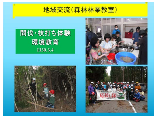
那賀川こまちの活動（橋本委員）