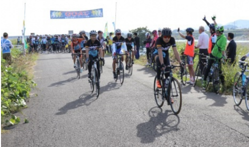
センチュリーラン活動報告（福住委員）

那賀川河川事務所では「ゆきかう那賀川推進会議」を通じ今後も流域の上下流交流を進めて参ります。