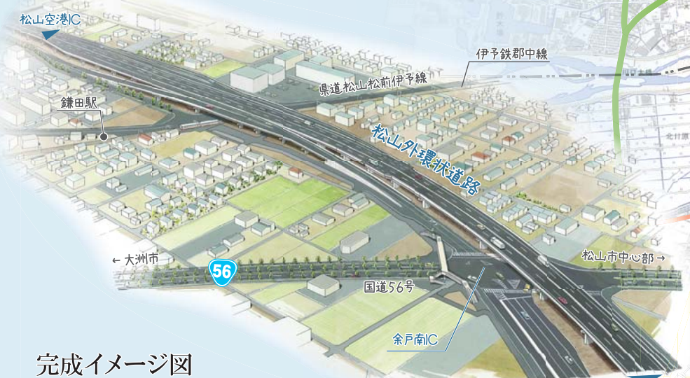
完成イメージ図 余戸南IC付近

平成27年度全国道路・街路交通情勢調査 観測地——生石町 T 15 =36,236台/12h——7時~19時 T 15 =49,281台/日 ※(市)松山環状線南部は、平成21年と平成23年の交通量観測結果