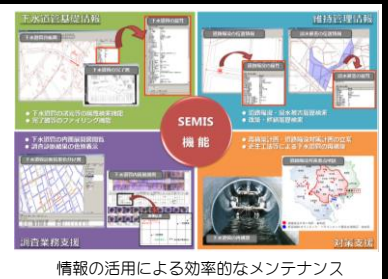
情報の活用による効率的なメンテナンス

東京都区部の下水道は国内最大の規模を誇り、下水道管網の総延長は16,000kmにも達している。 この膨大な下水道管のメンテナンスを効率的かつ効果的に実施するために、「下水道管のビッグデータ」を補修や再構築などの計画立案・工事発注に活用している。 ※「下水道管のビッグデータ」：下水道管基礎情報、維持管理情報、管路内調査診断情報、補修・再構築等の工事情報等に関する膨大な情報