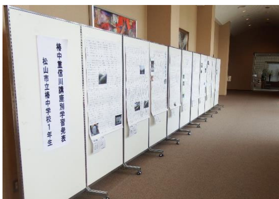
【松山市立 椿中学校1年生】 「椿中重信川講座別学習発表」校内発表資料