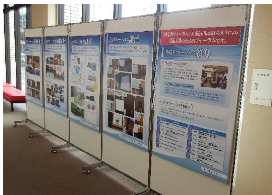
「重信川フォーラムの紹介」