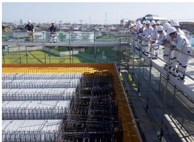
建設中の橋梁上部工の見学

舗装工事: ICTモーターグレーダーによる路盤の不陸整正作業(敷き均し高さを自動制御)の見学