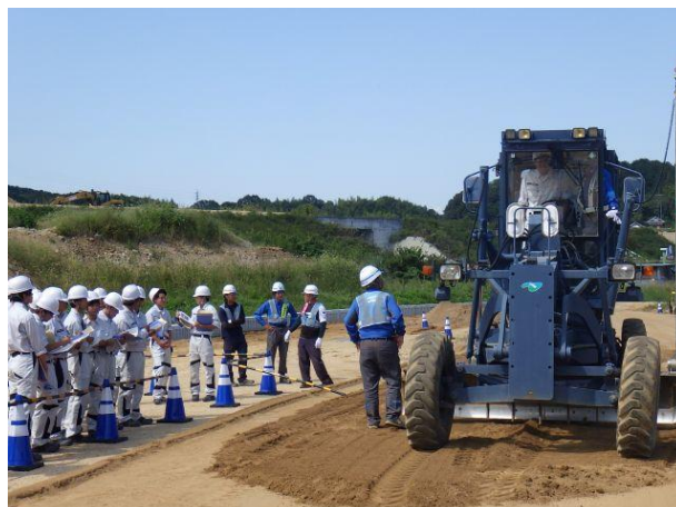
不陸整正作業の見学