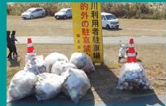
昨年度の清掃状況