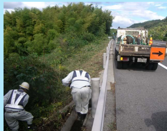
維持作業(水路清掃)