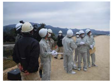
ドローン撮影・操縦体験