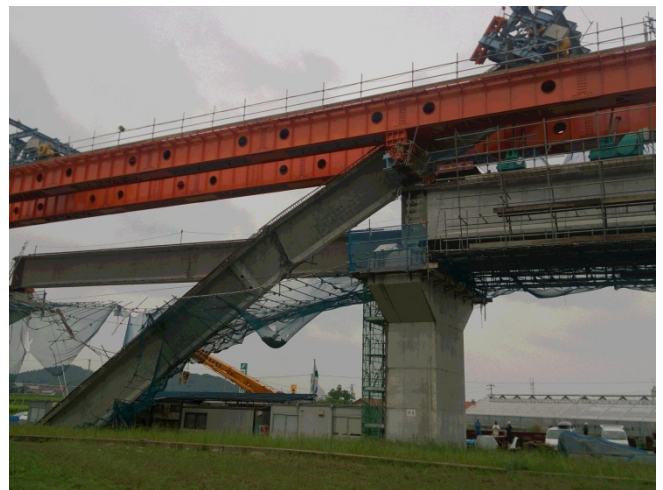
コンクリート桁の落下の状況(2)

※送り出し工法:コンクリート製の橋桁を架設桁(写真の赤い桁)で吊り下げ、送り出す工法