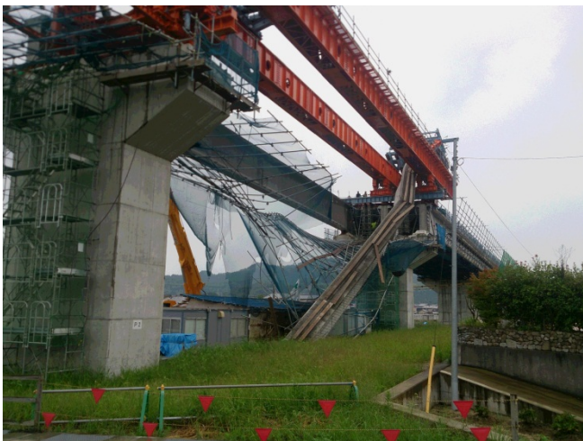
コンクリート桁の落下の状況(1)