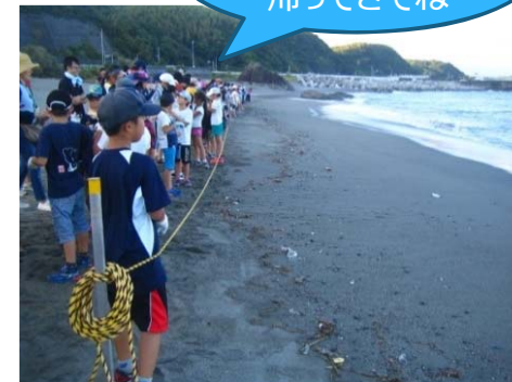
子ガメをお見送り