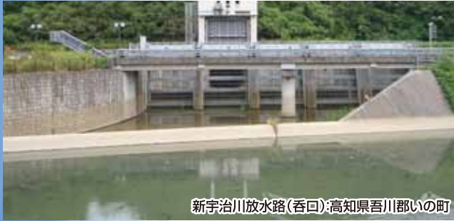
新宇治川放水路(呑口):高知県吾川郡いの町