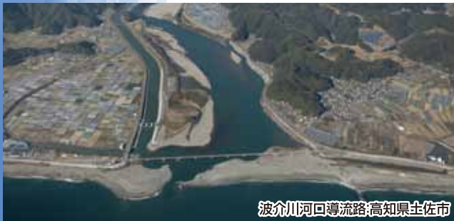
波介川河口導流路:高知県土佐市