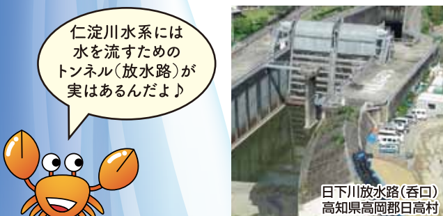
日下川放水路(呑口) 高知県高岡郡日高村