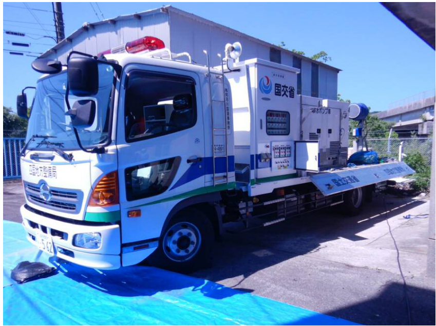
ポンプ車（高知河川国道事務所）