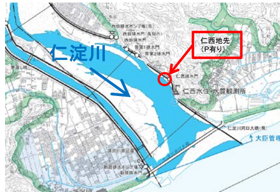
この地図は、国土地理院長の承認を得て、電子地形図25000を複製したものである。(承認番号 平成27情複、第502号)