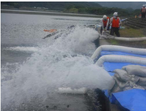
(令和2年度実施状況)