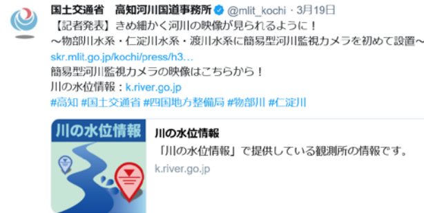
二次元コード、ハッシュタグの活用（川の水位情報）