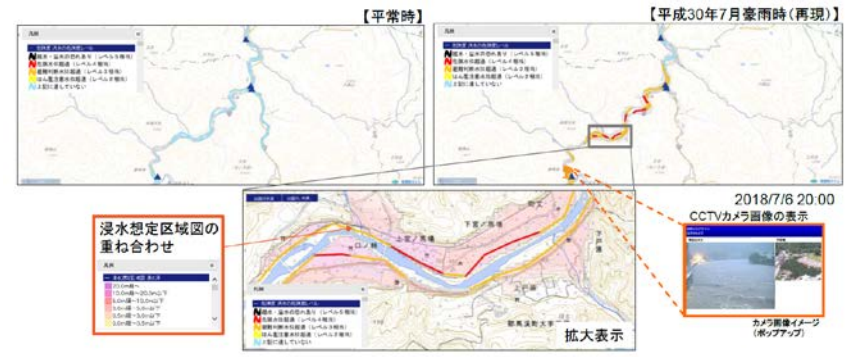
水害リスクラインに基づく水位予測、洪水予報の実施（イメージ）