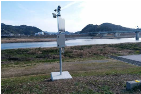
簡易型河川監視カメラの設置 (仁淀川右岸10.8k付近)