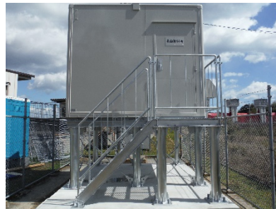
ダム放流警報施設等の耐水化、改良 (北山警報所)