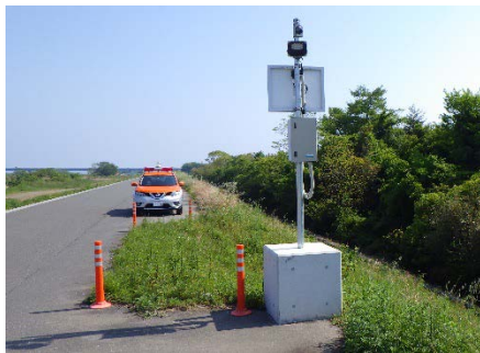
簡易型河川監視カメラの設置 (物部川右岸1k370付近)