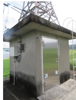
ダム放流警報施設等の耐水化、改良 (物部川右岸8k0付近)