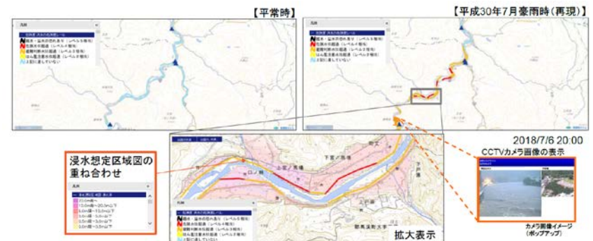
水害リスクラインに基づく水位予測、洪水予報の実施（イメージ）