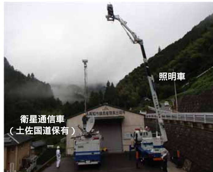
衛星通信車 (土佐国道保有)