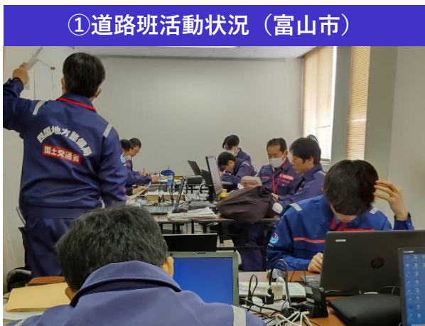
①道路班活動状況 (富山市)