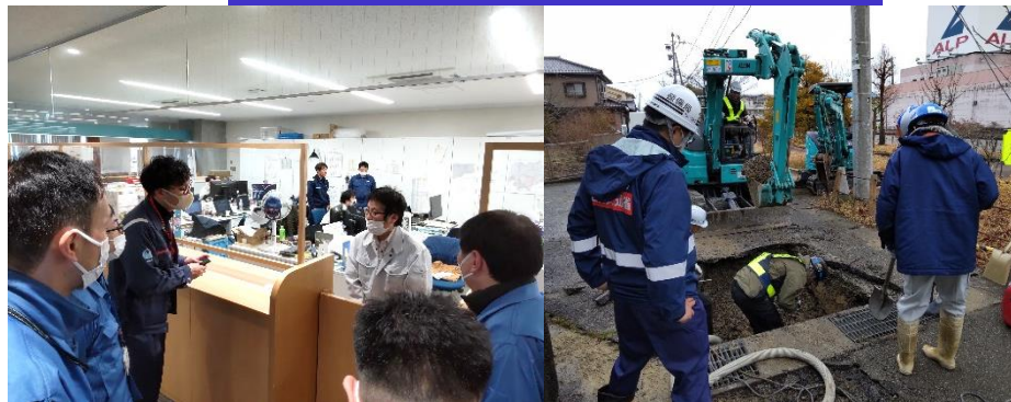
③水道班活動状況 (能登町)