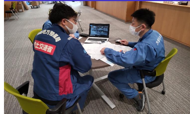
②水道班活動状況 (能登町)