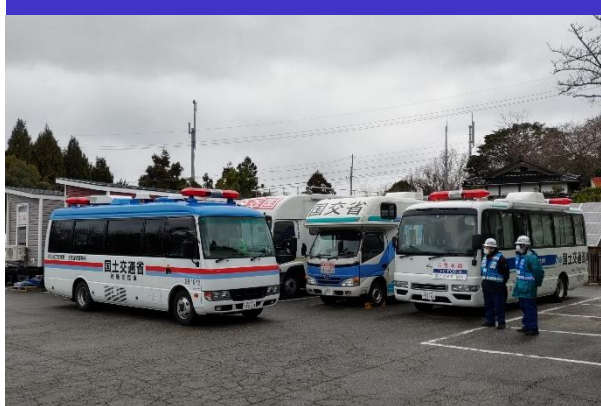
③待機支援車活動状況 (輪島市)