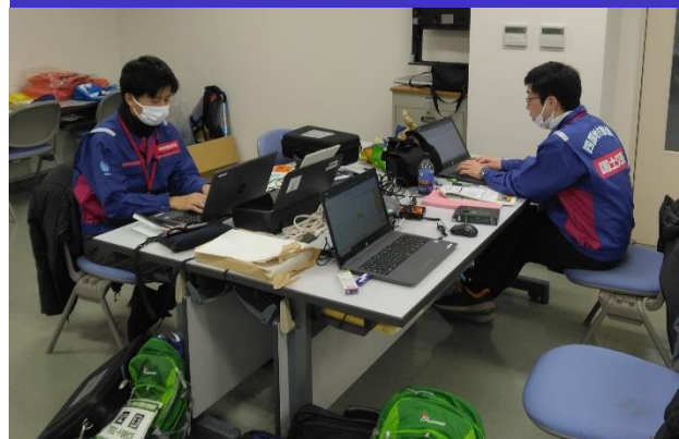
⑤給水支援班活動状況 (富山市)