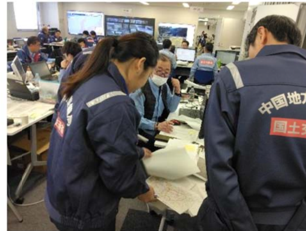
②総合司令班活動状況 (北陸地整)