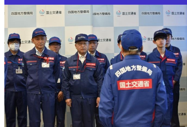
①②道路班、総合司令班出発式