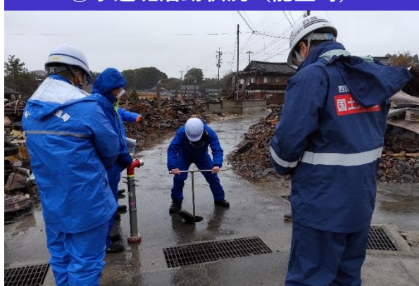
④水道班活動状況 (能登町)