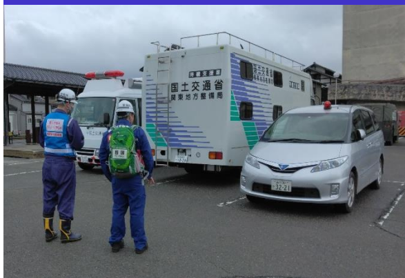
③待機支援車活動状況 (輪島市)