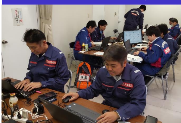
①道路班活動状況 (富山市)