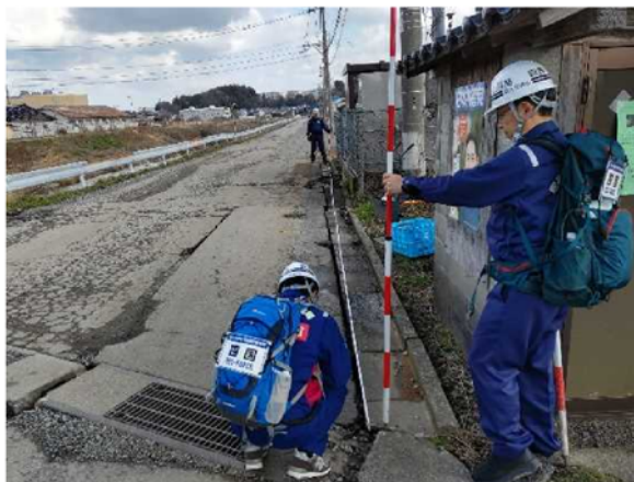
①道路班活動状況 (輪島市)