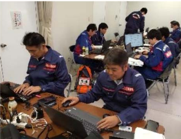
①道路班活動状況 (輪島市)