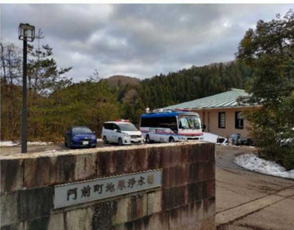
③待機支援車活動状況 (輪島市)