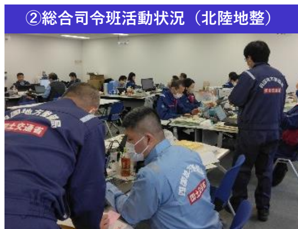
②総合司令班活動状況 (北陸地整)