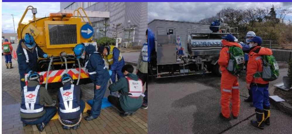
⑤給水支援班活動状況 (志賀町)