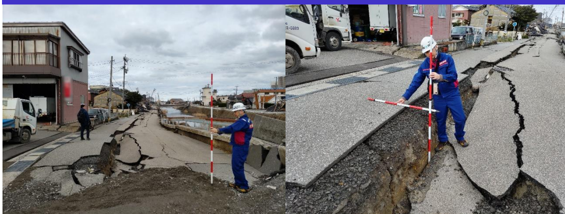
①道路班活動状況 (輪島市)