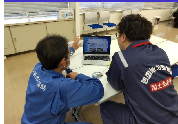
②水道班活動状況 (金沢市)