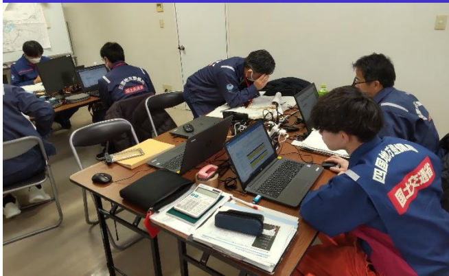
①道路班活動状況 (小矢部市)