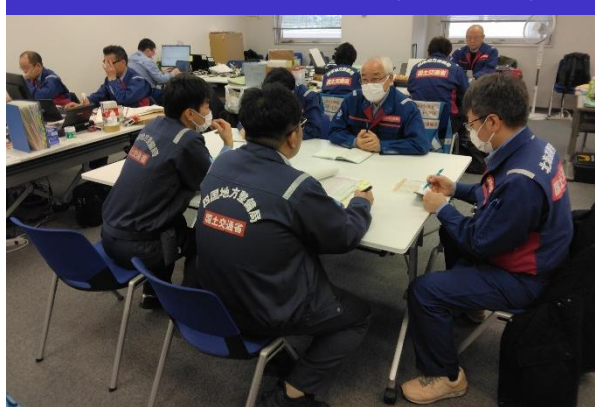
②総合司令班活動状況 (北陸地整)