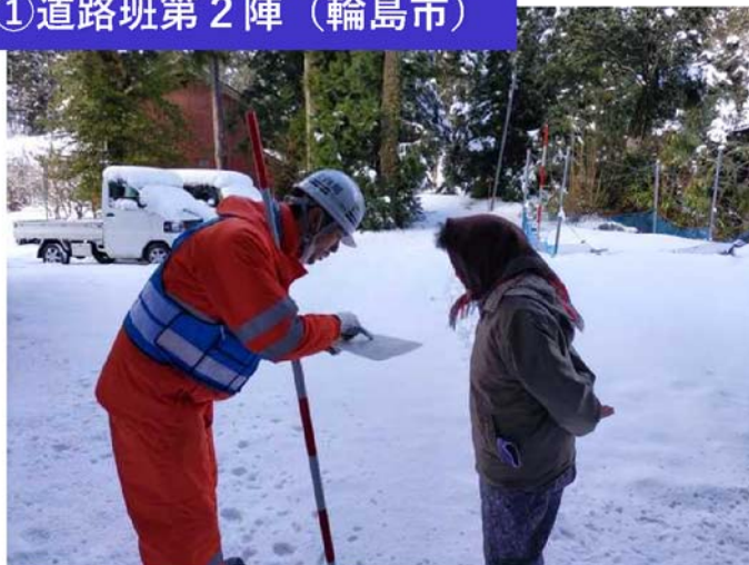
①道路班第2陣 (輪島市)