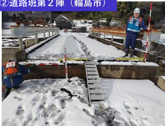
②道路班第2陣 (輪島市)