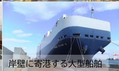
岸壁に寄港する大型船舶