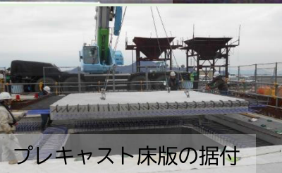
プレキャスト床板の据付