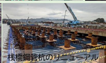
栈橋鋼管杭のリニューアル