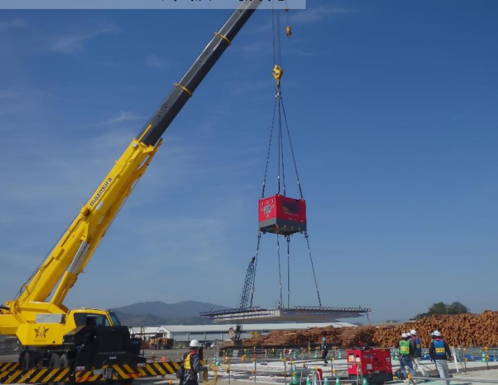
プレキャスト床板の据付

供用開始後40年以上経過し老朽化した岸壁を安全に利用できるよう、 上部工などのリニューアル工事を行っています。