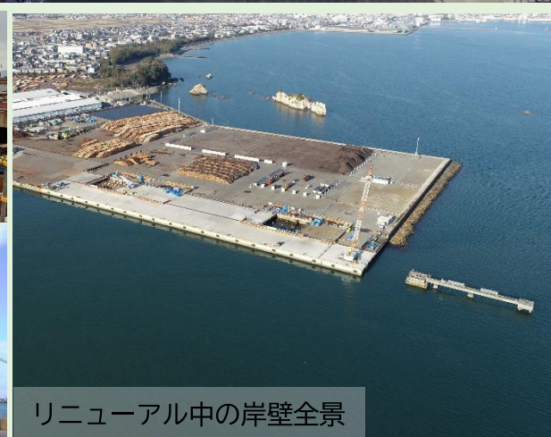
リニューアル中の岸壁全景