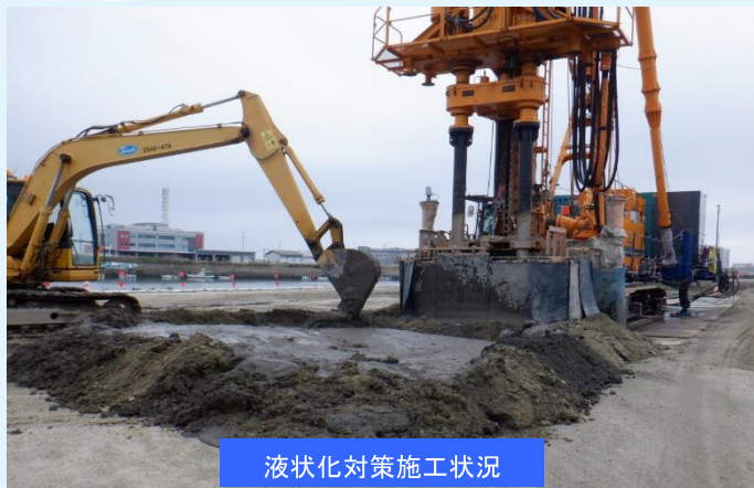
液状化対策施工状況