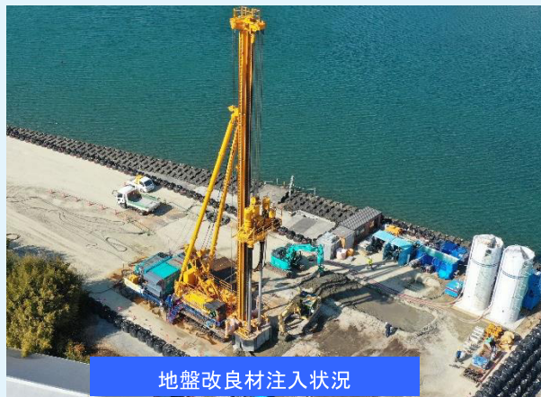
地盤改良材注入状況