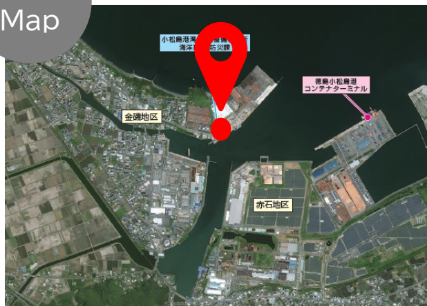
Satellite Image