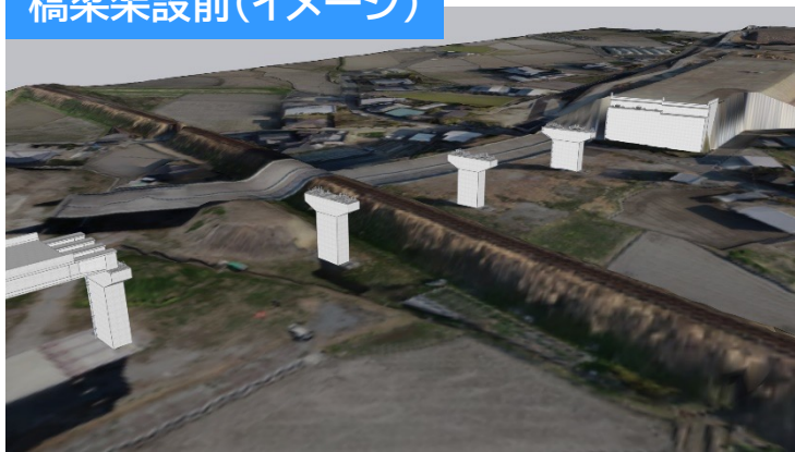
橋梁架設前(イメージ)