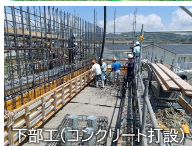
下部工(コンクリート打設)