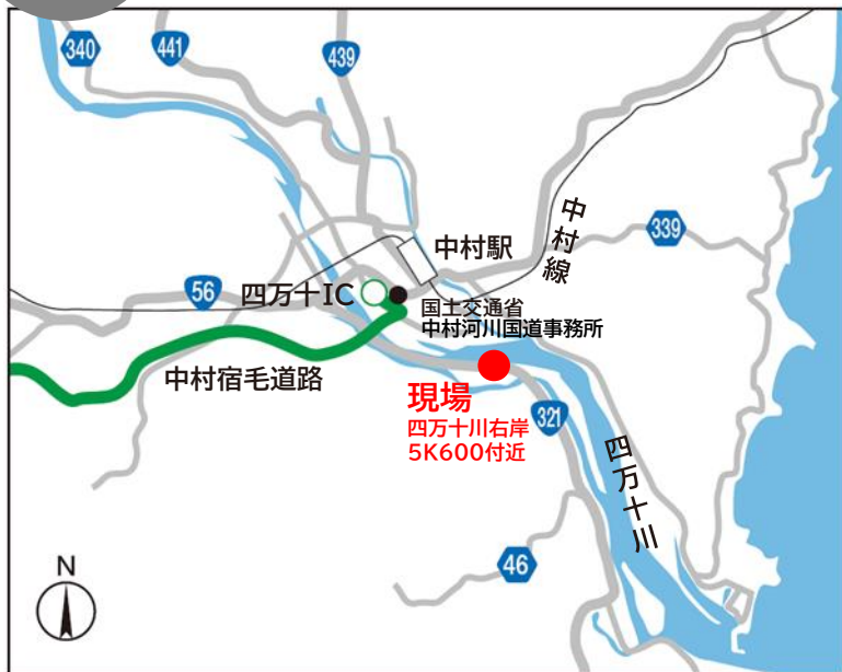
高知県四万十市山路付近