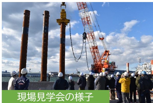
現場見学会の様子