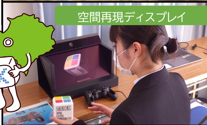
空間再現ディスプレイ