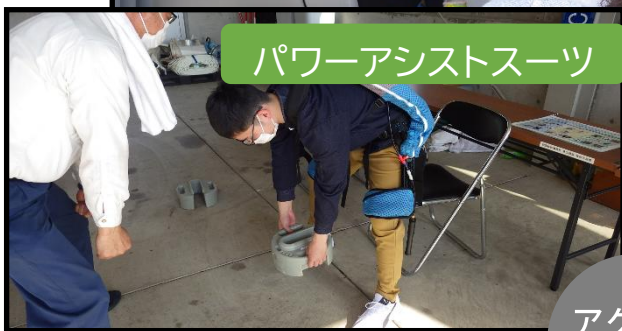
パワーアシストスーツ