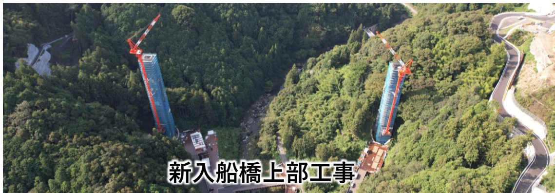
新入船橋上部工事