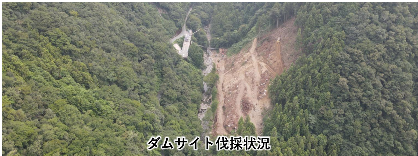
ダムサイト伐採状況

山鳥坂ダムでは、今年度からダム本体工事に着工します。 ダム本体や関連する道路、橋の工事現場などを見学できます。