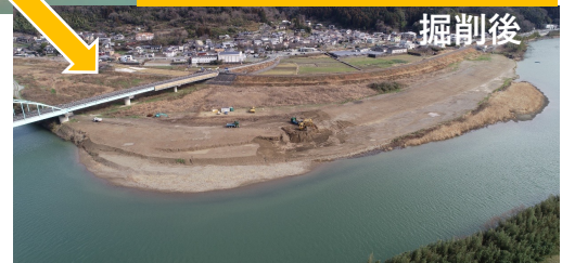
掘削前後変化イメージ