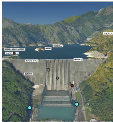
様々なフォーマットのデータをシームレスに 連携・表示