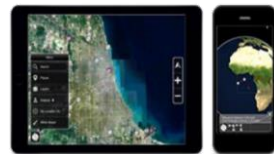
ブラウザビューアーで表示