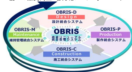
橋梁リニューアル統合管理システム『OBRIS』