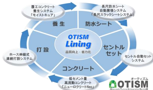
トンネル覆工の品質向上・省力化システム『OTISM®/LINING』