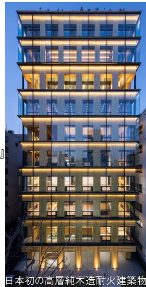
日本初の高層純木造耐火建築物