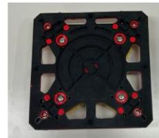
裏向きにすると消灯