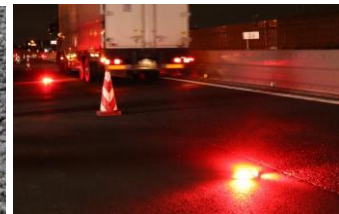
道路上で点滅するミチレスQ