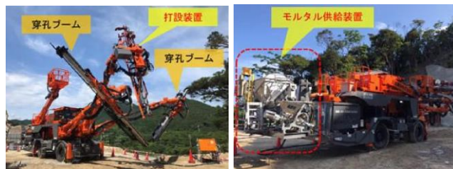
打設専用機全景(前方)