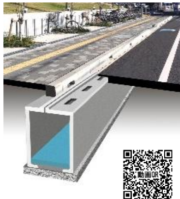
雨水貯留側溝「アクアゲッター」