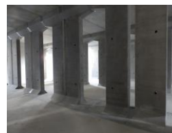
プレキャスト遊水池