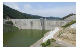
ダム関連製品(治水対策)