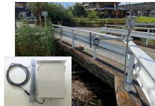
水位センサー・無線通信装置