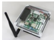
無線式加速度センサー