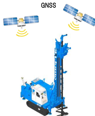
高精度のアンテナにてGNSSを受信

Y-Naviは、3次元計測技術を用いた出来形管理要領(第8編固結工(スラリー攪拌工)編)(案)に準拠したICT施工管理システムで、国土交通省が定めた「ICT建設機械等認定制度」において、2022年10月5日付で認定番号2022-44-2-5-1-0として認定されました。