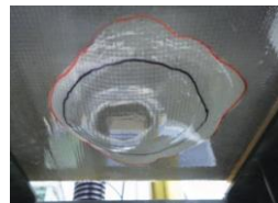
押し抜き試験状況