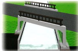
④斜角門形カルバート