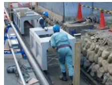
③マルチスライド工法