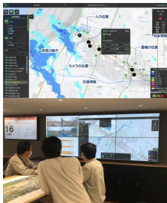
現場見える化する統合管理システム Field Browser(フィールドブラウザ)