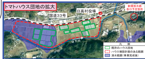
トマトハウス団地の浸水状況