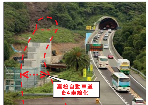
高松自動車道 を4車線化