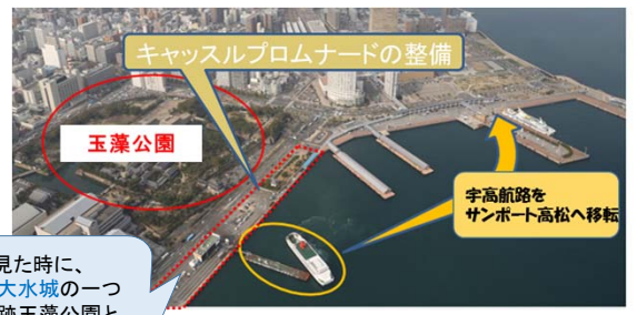
キャストルプロムナード イメージ図 (H22年度 キャストルプロムナード デザインコンペ 優秀作品より)