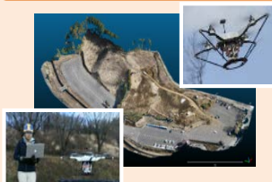
現況地形の 3次元点群データ化