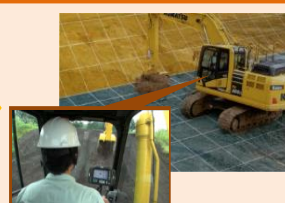
3次元設計データに 基づき建設機械を制御